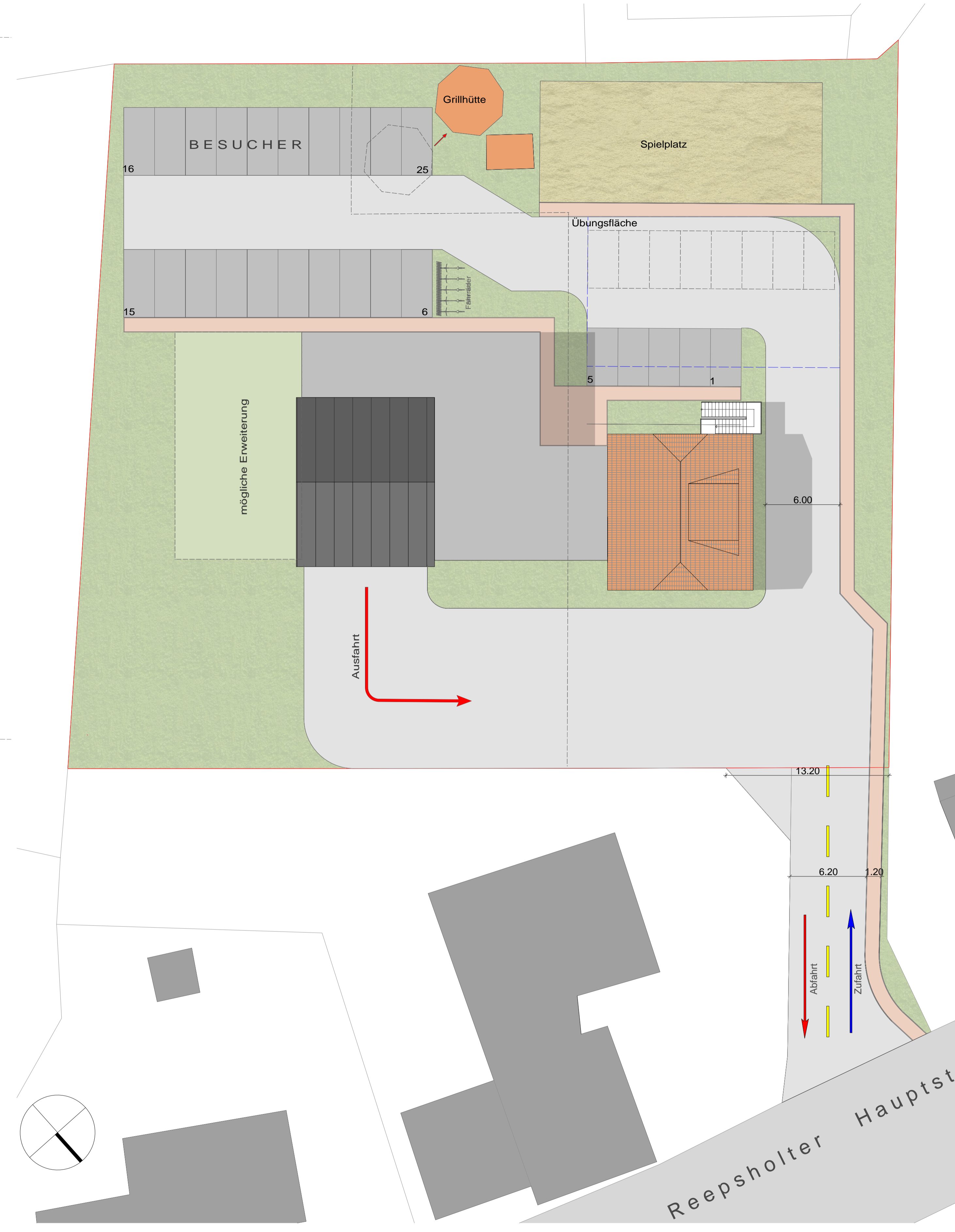
Lageplan m. 1:200

alle Maße sind vom ausführenden Unternehmen eigenverantwortlich zu prüfen und mit dem Bauherrn abzustimmen. diese Zeichnung ist urheberrechtlich geschützt, ohne schriftliche Genehmigung darf sie weder kopiert, vervielfältigt oder dritten Personen mitgeteilt oder zugänglich gemacht werden. 3ing architektur + ingenieur büro georgswall 10 26603 aurich tel 04941 60408-0 fax 04941 60408-11 info@3ing.de / www.3ing.de