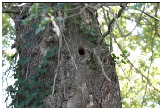
Abbildung 3 und 4: Bäume mit Höhlenstrukturen im Plangebiet

Außerhalb des Plangebietes (Fläche des B-Planes Nr. 9) liegen die Zufahrt mit Parkplatzbereich für den Barfußpark sowie das umschlossene Privatgrundstück mit Wohnhaus, Gartenfläche und Stillgewässer.