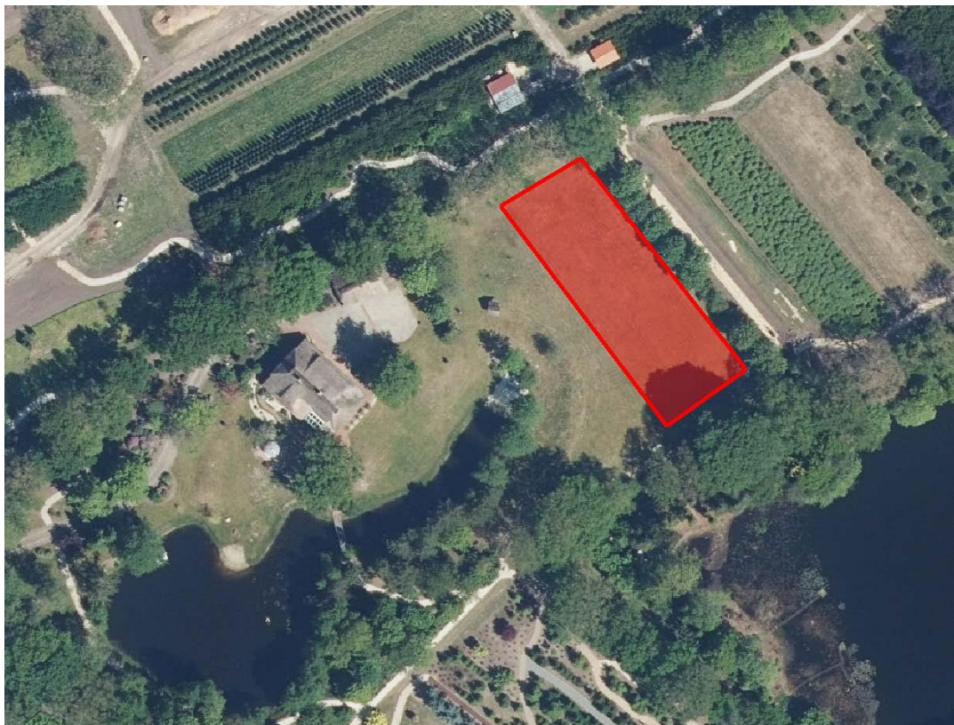
Abbildung 5: Lage der Kompensationsfläche (ohne Maßstab)

Das Aufbringen von Dünger und Pestiziden auf der Kompensationsfläche ist unzulässig.