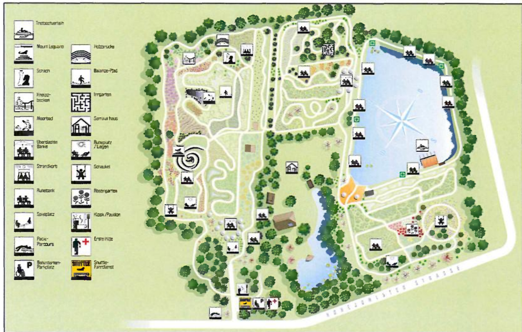
Abb.: Übersichtsplan Barfußpark Leguano, ohne Maßstab

Das geplante Vorhaben fügt sich in die Landschaft sowie die Parkgestaltung ein.